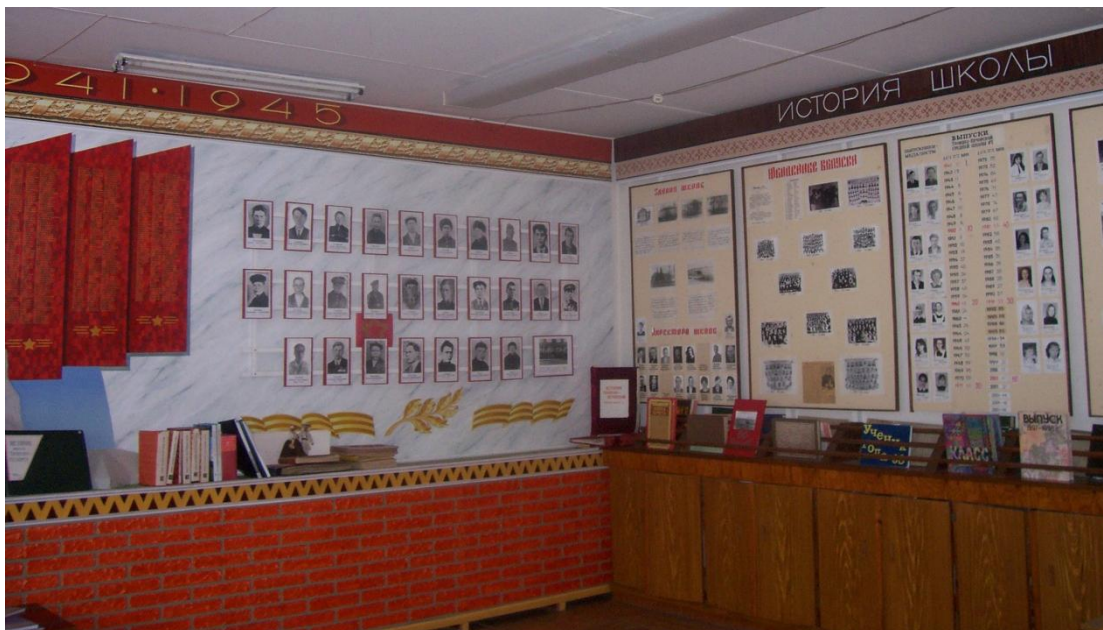
Экспозиции школьного музея