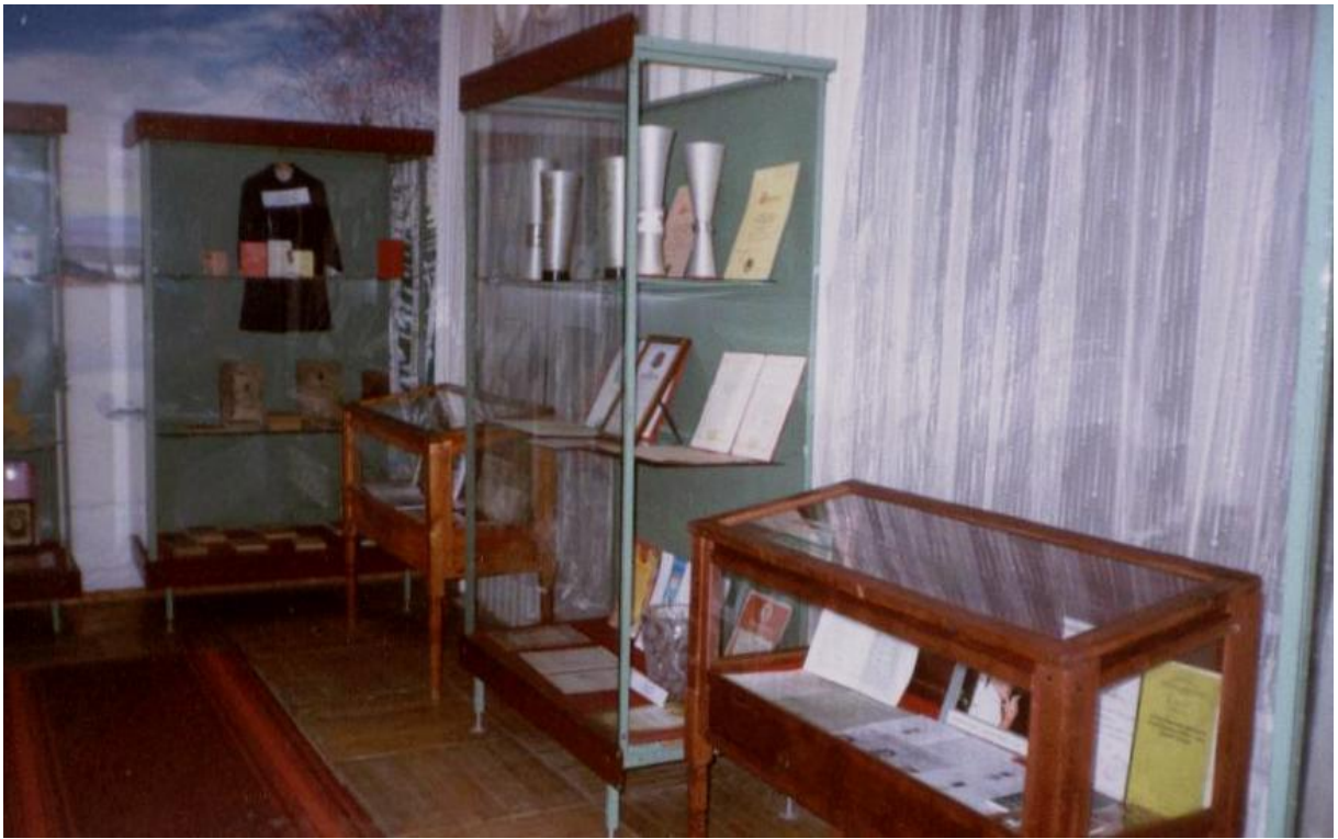
Экспозиция музея по истории школы