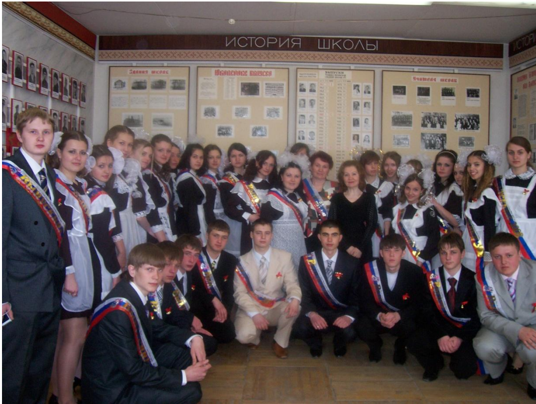
Традиционная экскурсия выпускников в день Последнего звонка (фотография на память)