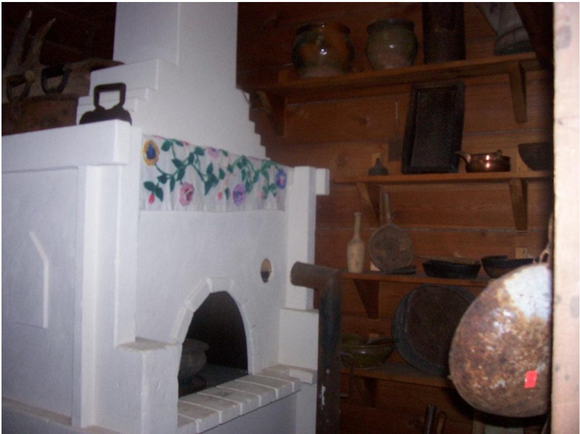
Уголок коми избы.