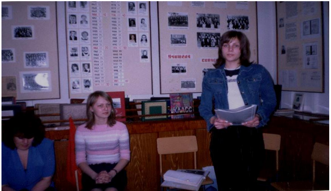
Идет заседание Совета музея